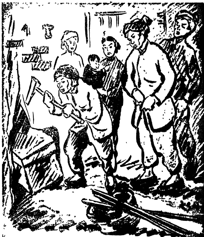
ಕರ್ಪೂರದ ಹಲಗೆಯ ಪೆಟ್ಟಿಗೆಯ ಚಿಲಕವು ಕಾಣಿಸಿತು.

ಚುವಾನನು ತಾನು ತಂದಿದ್ದ ಪಿಕಾಶಿಯಿಂದ ಗೋಡೆಗೆ ಬಡಿದು ಶಬ್ದಮಾಡಿ ದನು. ಜಮೀನ್ದಾರನ ಹೆಂಡತಿ ನಡುಗಿದಳು. ದಳದ ಸಿಪಾಯಿಗಳು ಭರ್ಜಿಗಳಮೇಲೆ ಊರಿ ನಿಂತು ಗೋಡೆಯಕಡೆಗೇ ನೋಡುತ್ತಿದ್ದರು. ಕೆಲವು ಇಟ್ಟಿಗೆಗಳು ಕಳಚಿದವು. ಒಂದು ಹಲಗೆಯು ಕಾಣಿಸಿಕೊಂಡಿತು. ಆ ಹಲಗೆಯನ್ನು ತೆಗೆದಮೇಲೆ ಒಂದು ದೊಡ್ಡ ಕರ್ಪೂರದ ಹಲಗೆಯು